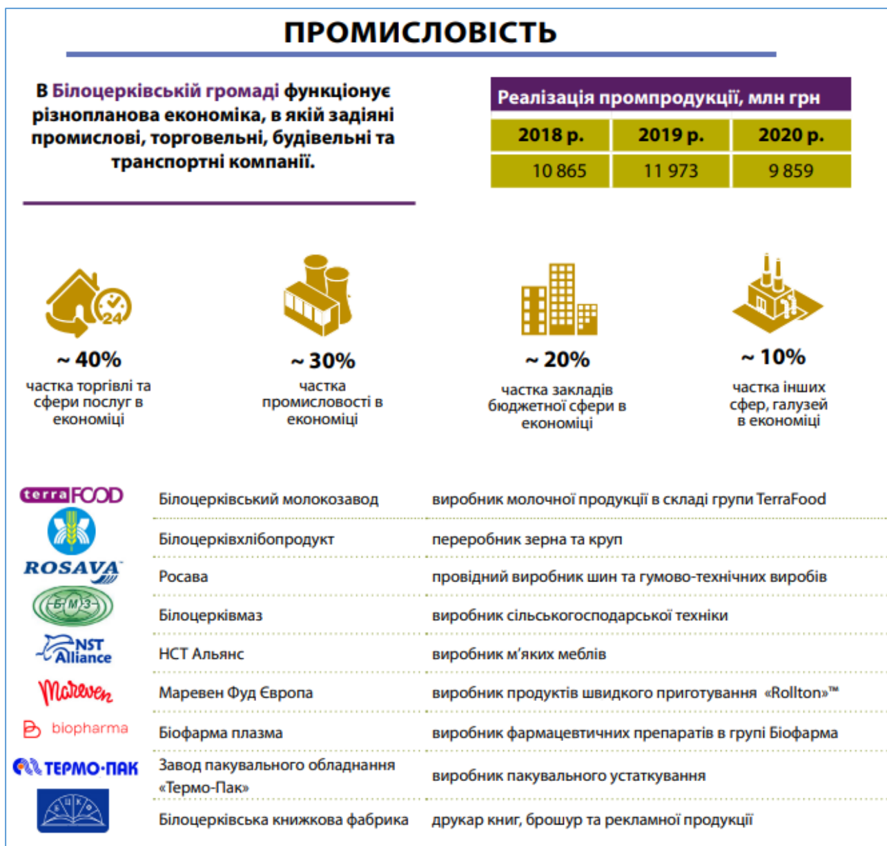
Рис. 2.3. Промисловий комплекс громади

Білоцерківська громада – значимий транспортний осередок країни: в місті функціонують дві залізничні вантажні станції та пасажирський вокзал, міський електричний та автомобільний транспорт, сертифікований аеродром, на базі якого планується створити міжнародний аеропорт та логістичний хаб.