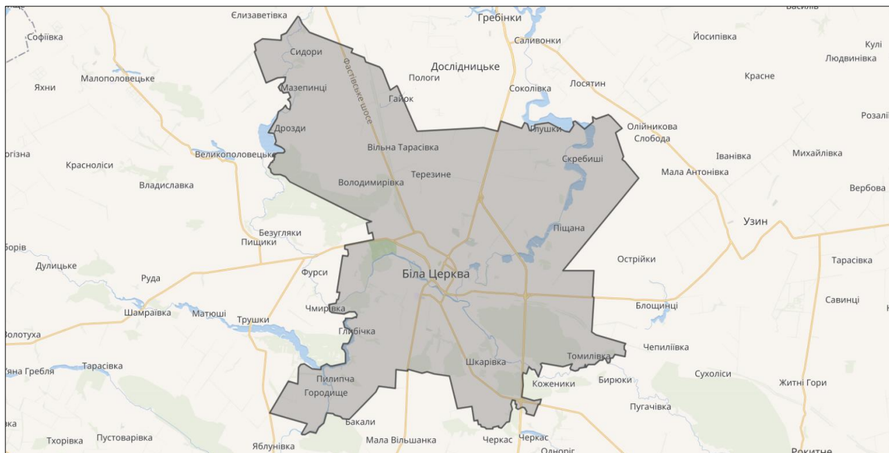
Рис. 2.2. Місцезнаходження Білоцерківської ТГ

У складі громади 1 місто (Біла Церква), 1 смт (Терезине) і 15 сіл: