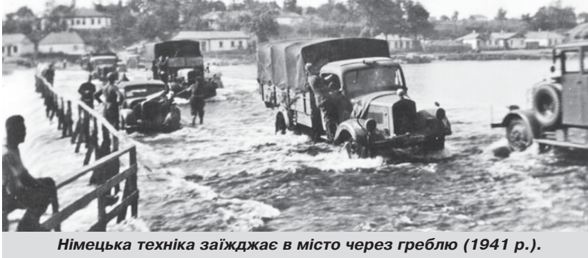
Німецька техніка заїжджає в місто через греблю (1941 р.).

Одного разу, коли я з друзями гнав корів із Товстої, а це було ближче до вечора, ми побачили, як до сьомого майданчика під'їхала машина. Від нас це було десь за кілометр. З машини когось витягли і розстріляли, а потім сіли в машину й поїхали. З цікавості ми вирішили підійти ближче і подивитися. Ще здалеку ми побачили багато крові