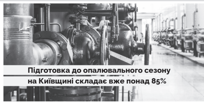
Підготовка до опалювального сезону на Київщині складає вже понад 85%

Підготовка до осінньо-зимового періоду на Київщині – на завершальному етапі. На сьогодні вона складає вже понад 85 відсотків. Про це повідомили у департаменті житлово-комунального господарства та енергоефективності Київської обласної військової адміністрації.