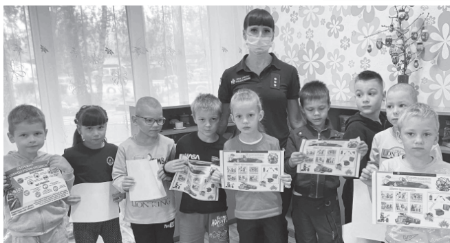
приладів. Дітям нагадали телефони екстрених служб та вручили інформаційні листівки з питань безпеки. Білоцерківське РУ ГУ ДСНС України у Київській області

Фахівці ДСНС розповіли дітям про порядок дій під час евакуації, до яких наслідків призводять пожеги з вогнем як у приміщенні, так і надворі, про правила поведінки на воді, поводження під час виявлення вибухонебезпечних