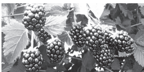
Ожинові плоди – чорнильні плями. За слідом слід потягнеться у даль, куці ожини вклоняться плодами, богемним хором вирветься печаль.

За слідом тим пильнують тільки зорі. Коли з віконниць упаде засува, віконна лиштва пустить в землю корінь, аби світанку жменю зачерпнув порожній дім – застоєне минуле, запліснявілі спогади і час, де ще ожини куці очей не муляв, де не було чорнильних плям на нас. Колюча терпкість уплелась у розкіш, затерп у листі плід – чорнильний хміль. І слід за слідом ти каміння мостиш, тікаючи з минулих божевіль.