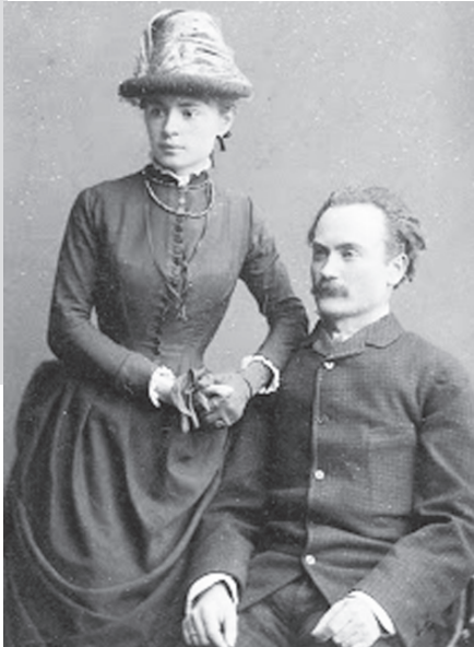
Іван Франко з дружиною Ольгою у день шлюбу. Київ, 4 (16) травня 1886 р.

Діти Франка, троє синів – Андрій, Петро і Тарас, а також дочка Ганна, були дуже збитковні. Наприклад, вони поливали перехожих водою з балкона або гатили цвяхи