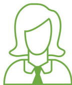
посадові особи місцевого самоврядування

Для окремих категорій працівників надання матеріальної допомоги на оздоровлення є обов'язковим. До них належать, зокрема: