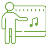
педагогічні працівники закладів сфери культури