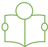
працівники музеїв і бібліотек