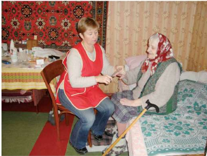
- домашній патронаж,

Перелік послуг, які він надає, надзвичайно великий: