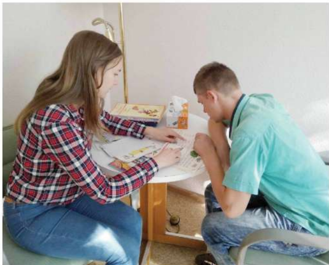
- послуги юристів та психологів, соціальна підтримка,