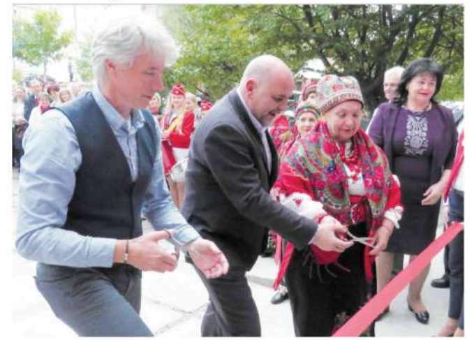
Нещодавно було відкрито філію Терцентру! Вона знаходиться за адресою вул. Стуса, 34.