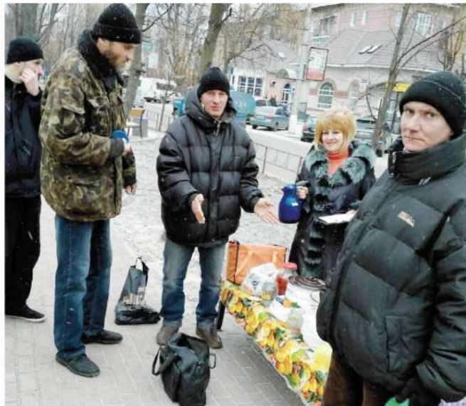
- соціальне таксі та бюджетні послуги перукаря і швачки, поміч у скрутних життєвих обставинах.