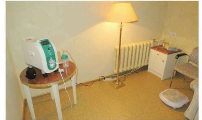
Такі ж чудові приміщення, такі ж прекрасні умови й повний перелік послуг для білоцерківців!