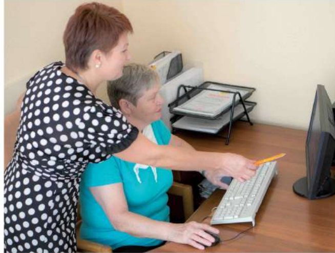
факультет комп'ютерної грамотності «Мій друг – комп'ютер».

англійської філології; польської мови; німецької мови; хорового співу «Берегиня»; декоративно-прикладного мистецтва «Золоті ручки»; психологічний факультет;