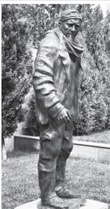
Пам'ятник Герою України О. Мацієвському, встановлений у Тбілісі.