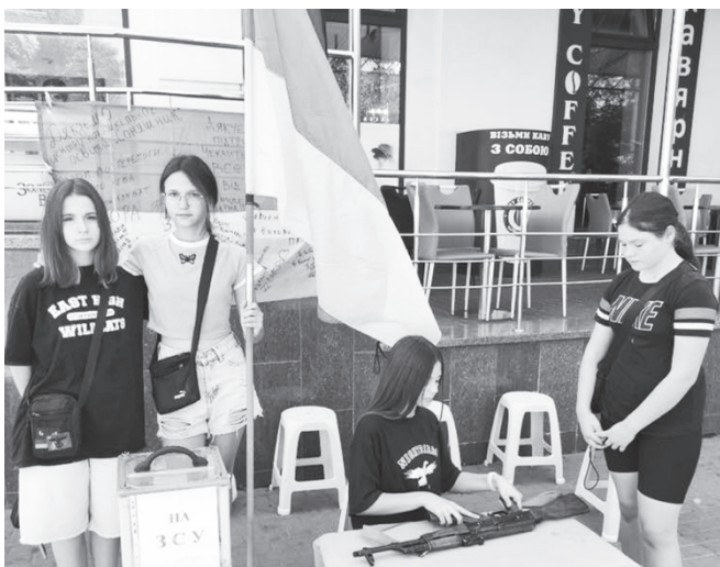
Юні патріоти з гуртка «Лицарська звитяга» продовжують збирати кошти на підтримку ЗСУ.

НИЗЬКО КЛАНЯЄМОСЬ ГЕРОЯМ-ЗЕМЛЯКАМ ЗА РАТНИЙ ПОДВИГ, ЗА ЛЮДЯНИСТЬ І ЖЕРТОВНИСТЬ, ЗА НАШУ МОЖЛИВІСТЬ ЖИТИ. НЕХАЙ НІЩО Й НІКОЛИ НЕ ЗМУСИТЬ НАС ЗАБУТИ ЇХНІ ІМЕНА.