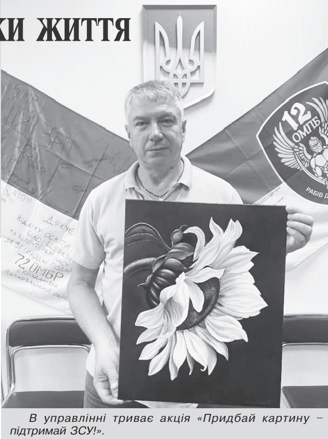
В управлінні триває акція «Придбай картину – підтримай ЗСУ!».

Нинішня тема першого уроку буде пов'язана з нинішньою ситуацією в Україні, з війною. Ми вшануємо наших героїв, і живих, і тих, які загинули, захищаючи нашу незалежність. Відповідно налаштуємо дітей на національно-патріотичну хвилю й