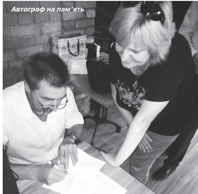
Автограф на пам'ять