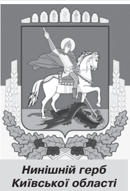
Нинішній герб Київської області

У Київській обласній військовій адміністрації презентували перші напрацювання геральдистів щодо нового герба та прапора області депутатам Київської облради, керівникам громад та мерам міст. Далі буде широке обговорення в громадах, повідомляє управління комунікацій КОВА.