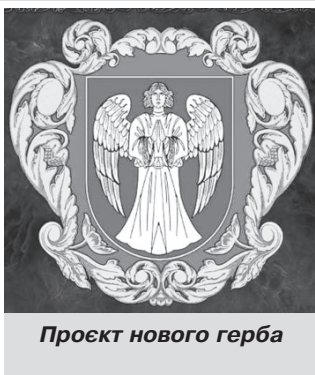
Проект нового герба

прапора пройшли експертизу Інституту історії НАНУ, який підтримав ініціативу позбутися будь-яких натяків на зв'язок сучасної геральдики з імперським минулим.