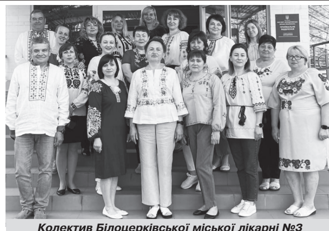
Колектив Білоцерківської міської лікарні №3

В Білоцерківських міських лікарнях №1, №3 та пологовому будинку стаціонарно пролікували 7609 пацієнтів, з них 156 – вагітні жінки. В період підйому захворюваності кількість ліжкомісць збільшувалась майже до 400. Цей час став важким випробуванням для медичних працівників, періодом надлюдських навантажень для лікарів та всього медперсоналу.