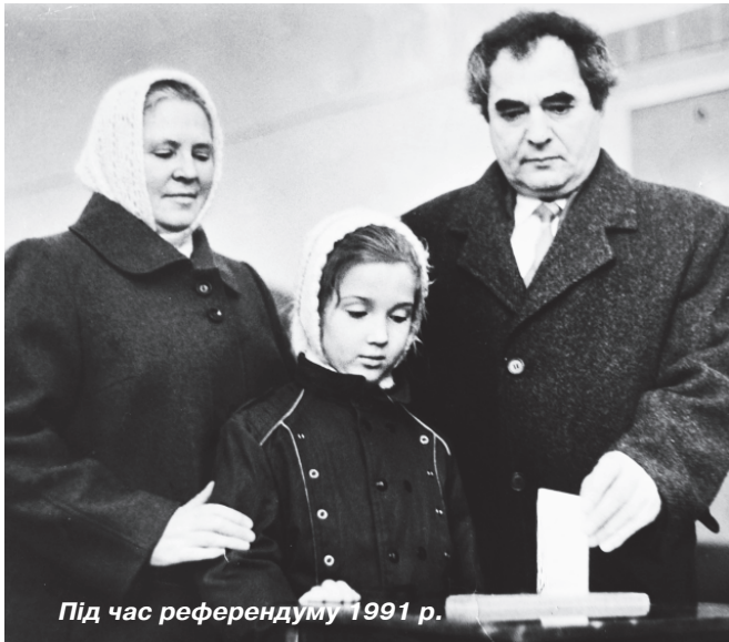
Під час референдуму 1991 р.

ремонті мережі, завідувача водопровідної мережі, начальника водопровідної мережі.