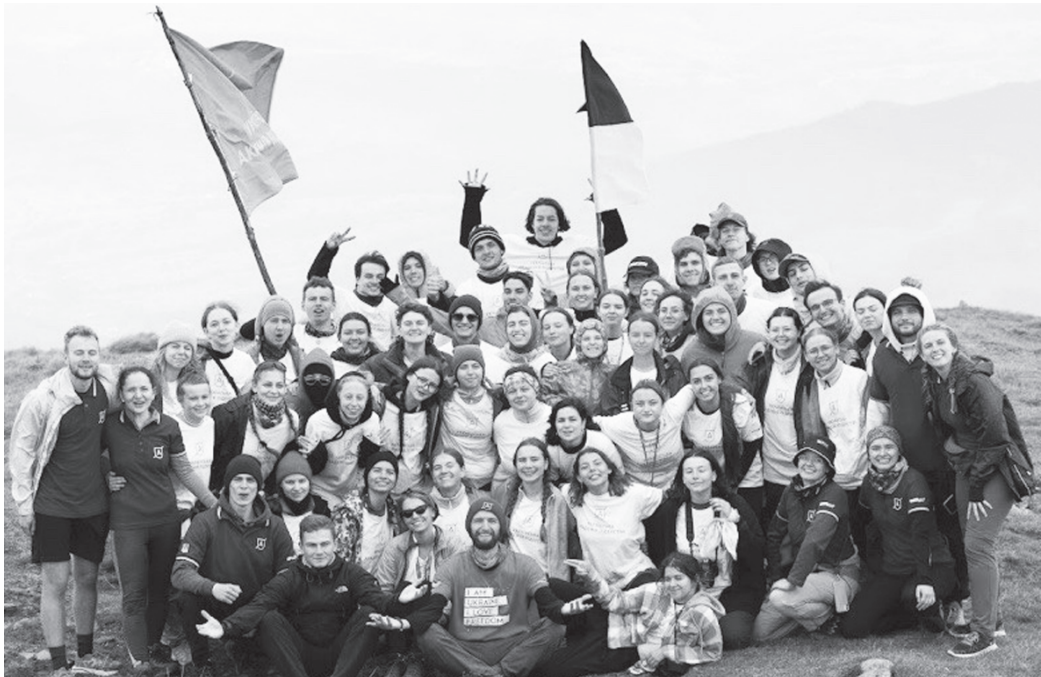
Сайт Української академії лідерства: https://www.ual.ua/ua/?utm_source=chatbot&utm_medium=email&utm_campaign=RK2024_3

Добре, коли навіть у такий складний час, який ми переживаємо нині, з'являються й гарні новини. Такі, приміром, як народження дитлахів. А в Білоцерківській громаді нещодавно ще у двох сім'ях на світ з'явилися одразу двоє малюків.