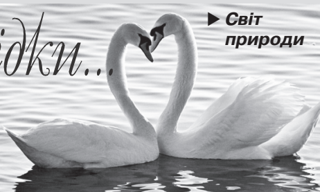
► Світ природи