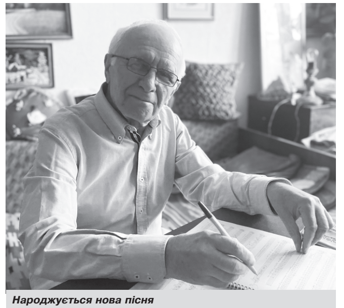
Народжується нова пісня