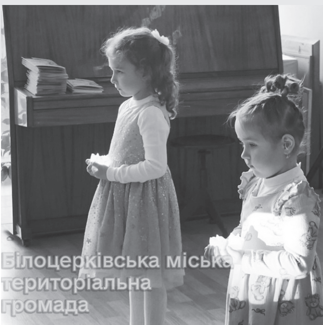
Білоцерківська міська територіальна громада

– Сьогодні – прекрасне свято. Саме жінки дають життя, жінки, які гордо несуть звання «Мама». Якщо немає мами, діти стають сиротами. Але дуже несправедливо, коли батьки ховають своїх дітей... Ви –