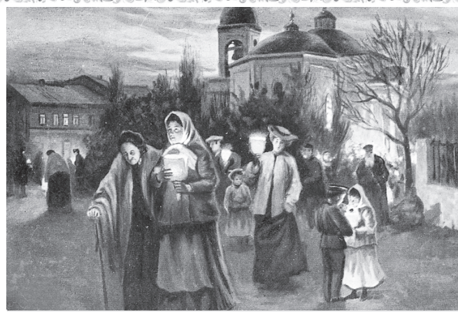
«Вихід з церкви в Страсний четвер»

Нехай наша радість у Христі Воскреслому примножується в нас, а через нас – і в усьому світі. Будемо ж