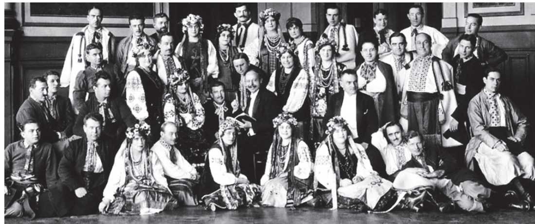
Український національний хор, очолюваний Олександром Кошицем, на гастролях в Аргентині. 1923 рік.