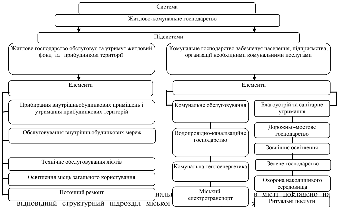
назва відповідний структурний підрозділ міської господарства Білоцерківської міської ради (ДЖКГ).

Інша характеристика ЖКГ пов’язана з комплексністю галузі, яка характеризується великою кількістю підгалузей (Рис. 1.1).