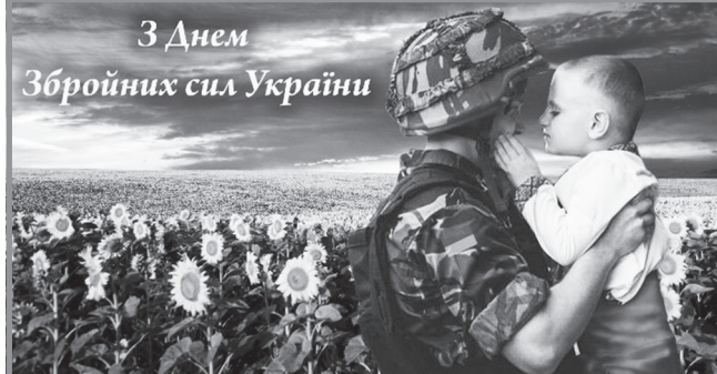
3 Днем Збройних сил України

ЩИРО ВІТАЮ з Днем Збройних сил України всіх, хто присвятив своє життя військовій службі!