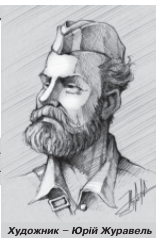
Художник – Юрій Журавель

▲ Впродовж 1941-1943 років Бульба-Боровець, репрезентуючи інтереси екзильного уряду УНР, вів