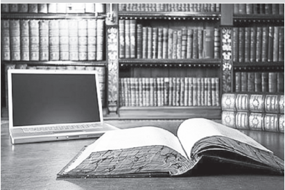
Продовження. Початок на 1 стор.

♦ Перед бібліотеками стоїть завдання бути затребуваними, відповідати запитам сучасних користувачів. Адже від цього залежить місце бібліотек в інформаційному світі, і їхня місія – бути завжди на крок попереду, пізнавати нове і передавати користувачам. Цьому, звичайно ж, сприяють заходи з підвищення кваліфікації, які організовує методичний відділ ЦБС. Працівники відділу використовують інтерактивні методи сприйняття інформації, вчать колеги мислити нестандартно, працювати в команді.