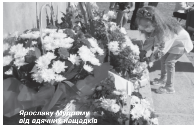
Ярославу Мудрому – від вдячних нащадків

Нас, її мешканців, більше двохсот тисяч, і всі ми різні. Хтось приїхав сюди вчитися, хтось – будувати кар'єру, знайшов тут любов і створив сім'ю. Дехто прожив тут усе життя, а дехто завітав лише на кілька років. Хтось закохався у це місце з першого погляду, а хтось зізнається, що так до нього і не звик, хоча прожив тут пів життя. Що ж, все одно кожен із нас зробив свій внесок в історію Білої Церкви, так само, як і вона – в наші особисті життєписи. І в сумі це породжує щось неймовірне, глибоке і прекрасне. У сумі це 988 років, відколи над Росією стоїть град, фортеця і дім.