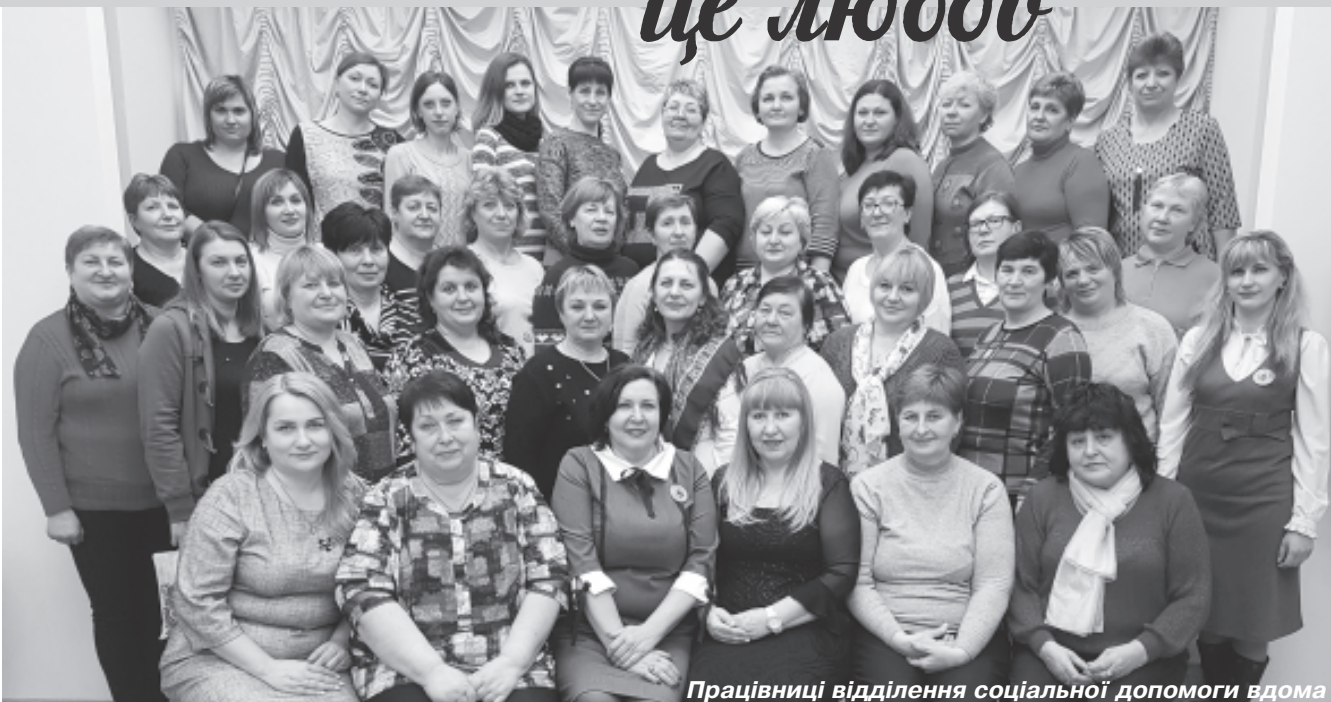
Працівники відділення соціальної допомоги вдома

Єдина річ, яку залишили у цьому світі, – це любов