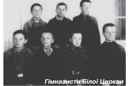
Гімназисти Білої Церкви

Варто зауважити, що «грінченківці», як і керівництво гімназії, не стояли осторонь