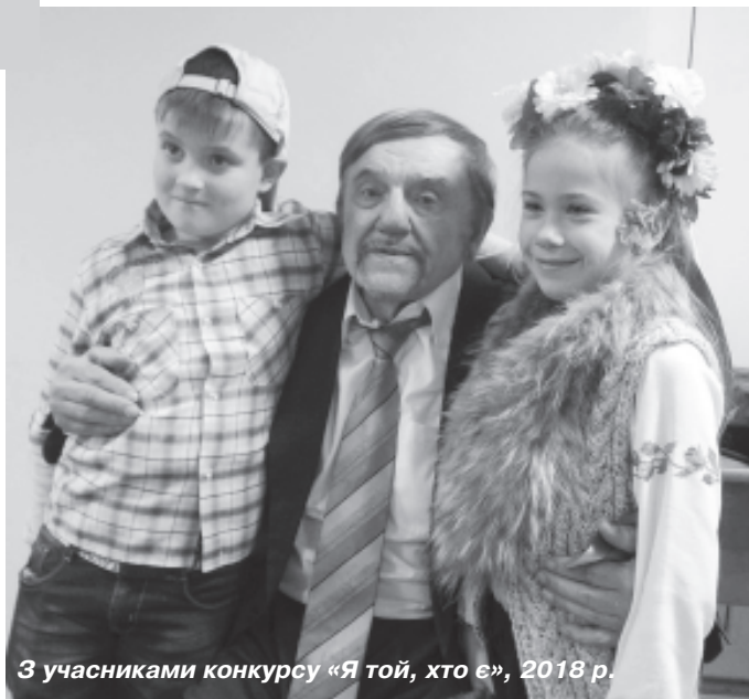
З учасниками конкурсу «Я той, хто є», 2018 р.