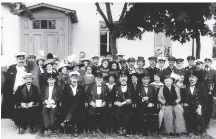
Викладачі Білоцерківських гімназій початку ХХ ст.

З 1872 по 1884 рік замість реальної гімназії в місті вже існувало реальне 6-класне училище, але в ньому був додатковий сьомий, комерційний, клас. В цьому закладі переважно вивчали точні та технічні дисципліни. Випускники училища ставали студентами таких навчальних закладів, як Варшавський університет, Цюрихський технологічний інсти-