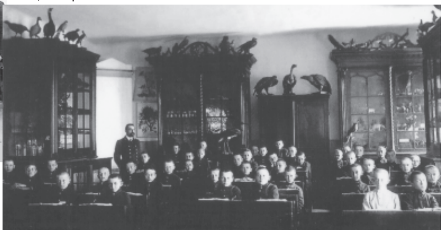
Урок біології в Білоцерківській класичній гімназії.

Всі, крім єврейської чоловічої, розміщувалися в одному приміщенні, де нині один із корпусів БНАУ.