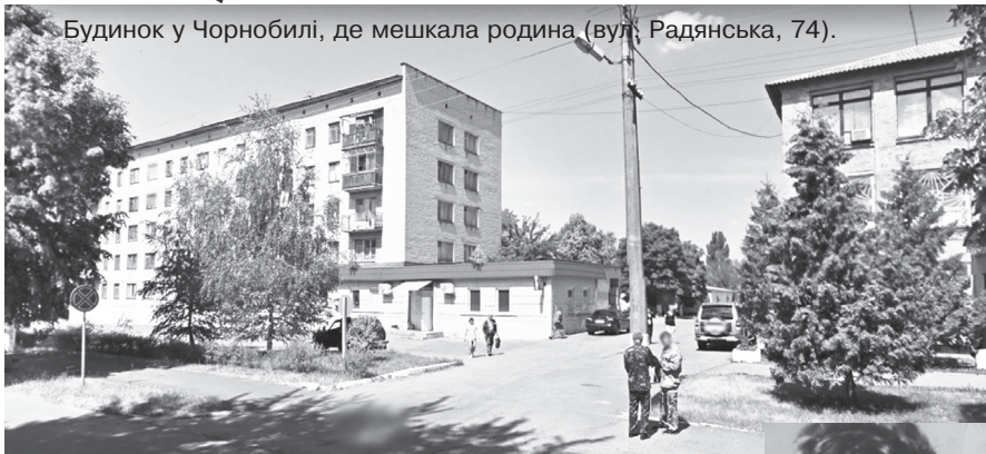
Будинок у Чорнобилі, де мешкала родина (вул. Радянська, 74).