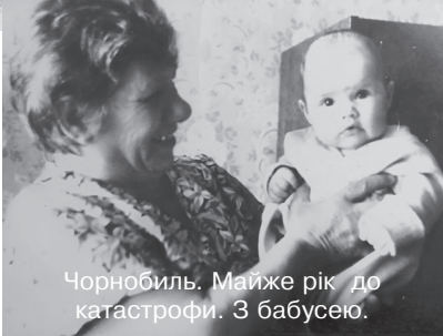
Чорнобиль. Майже рік до катастрофи. З бабусяю.