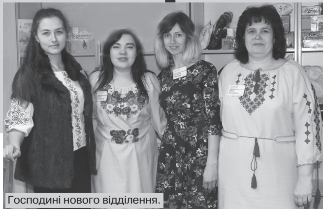
Господині нового відділення.

Кілька років тому спробу ошасливити місцевих повторили люди, які міти-