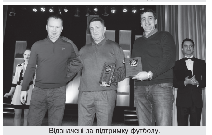
Відзначені за підтримку футболу.