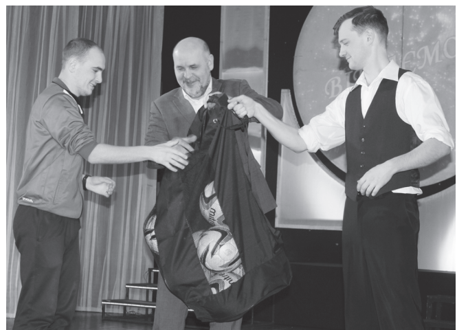
Міський голова вручає подарунки.