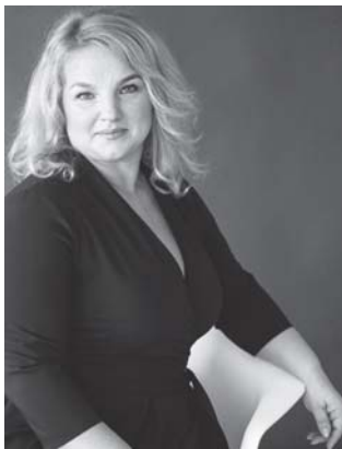
Людмила МЕРЗЛЮК, голова Білоцерківської райдержадміністрації