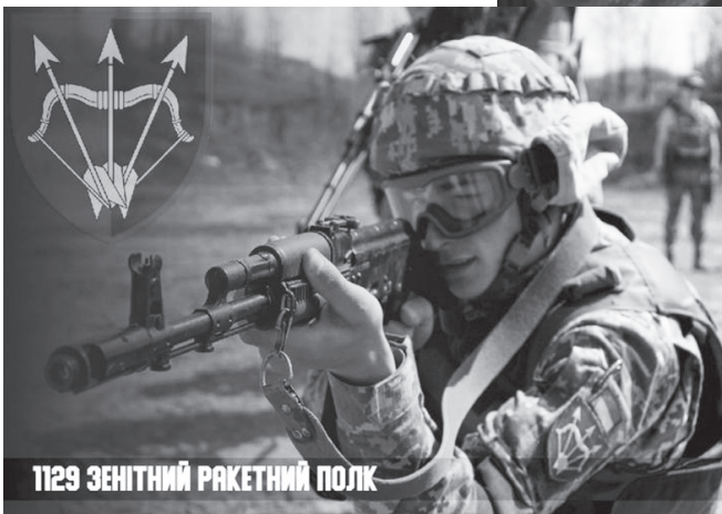
1129 ЗЕНІТНИЙ РАКЕТНИЙ ПОЛК