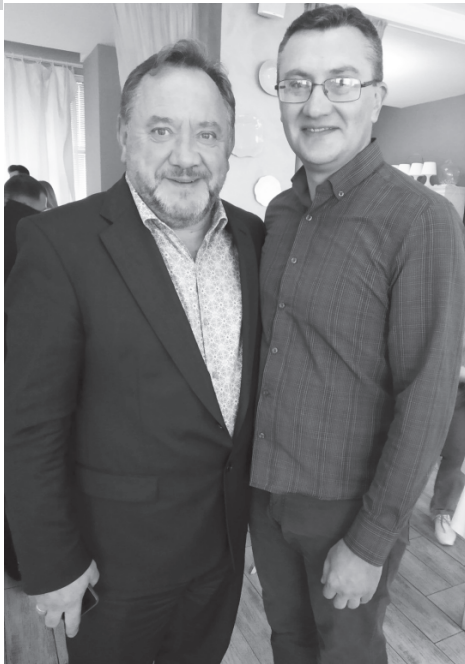
З народним артистом України Богданом Бенюком