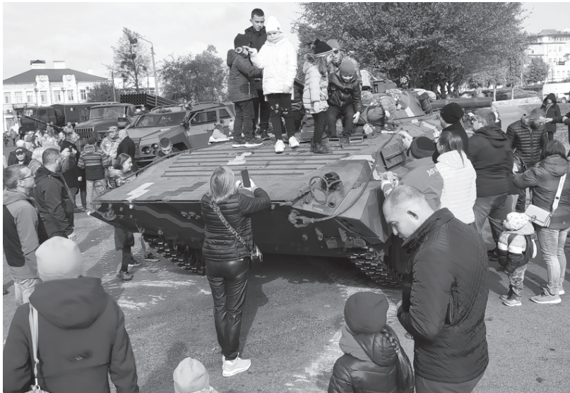
Виставка військової техніки найбільше привабила дітлахів.

Цього дня ми сповнюємося вдячністю до захисників, а наша віра в перемогу міцніє. Але це водночас і сумний день. Страшенна туга огортає наші серця, коли ми тремтливими пальцями доторкаємося до тих маленьких фотографій на меморіалі, коли нашими душами, мов скривавленим степом, шириться «Плине кача» або «Чорна рілля ізорана», коли в чужих очах бачимо ті ж сльози, що й у своїх. Бо за нашими плечима стоїть безтілесне, нетлінне військо з полеглих героїв. Вони дивляться на нас суворо. Вони чекають, що ми не осоромимо їхньої пам'яті, що залишимося такими ж нескореними, як і вони.