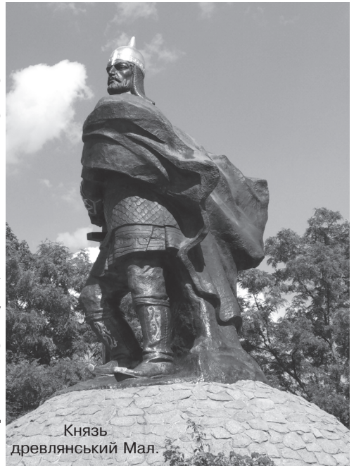
Князь древланський Мала.

Масштаби бункера та якість будівництва в ньому вражають. Проте багато загадок «Скеля» ще зберігає, тож факхівцям є надчим працювати.