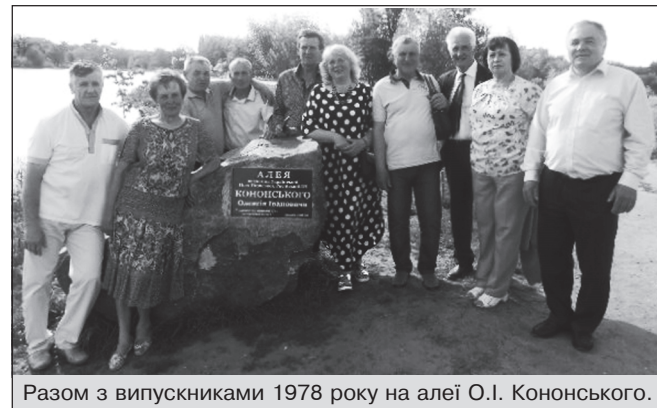
Разом з випускниками 1978 року на алеї О.І. Кононського.

Педагогічна справа стала для нього змістом життя, проте суспільні проблеми є болючими й важливими. Відтак нинішні життєві будні