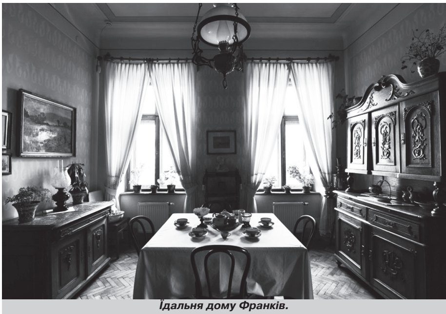
Ідальня дому Франків.