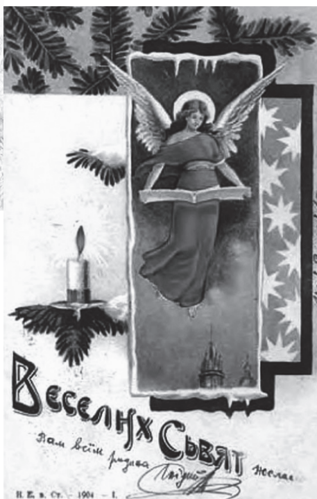
Різдвяна листівка часів Івана Франка.

Рання поезія «Опись Святого Вечора», позначена значною мірою автобіографізмом, дозволяє реконструювати оті прадавні звичаї святкування Пісної вечері у вітцівській хаті поета в Нагуевичах. Етнографічна