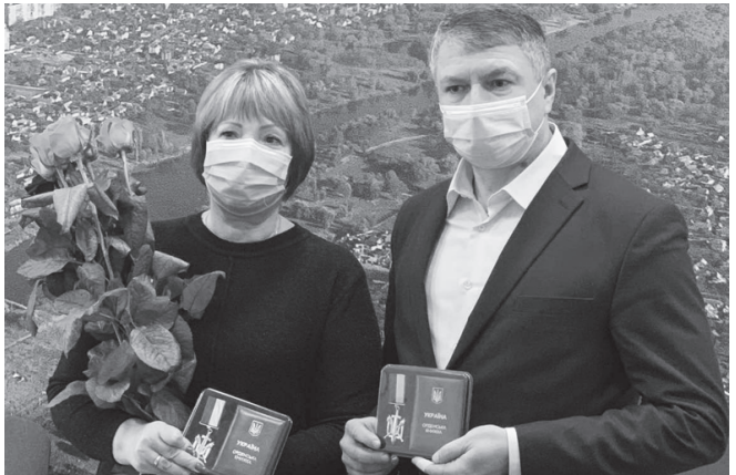
Рішення виконавчого комітету Білоцерківської міської ради від 22 грудня 2020 року № 750